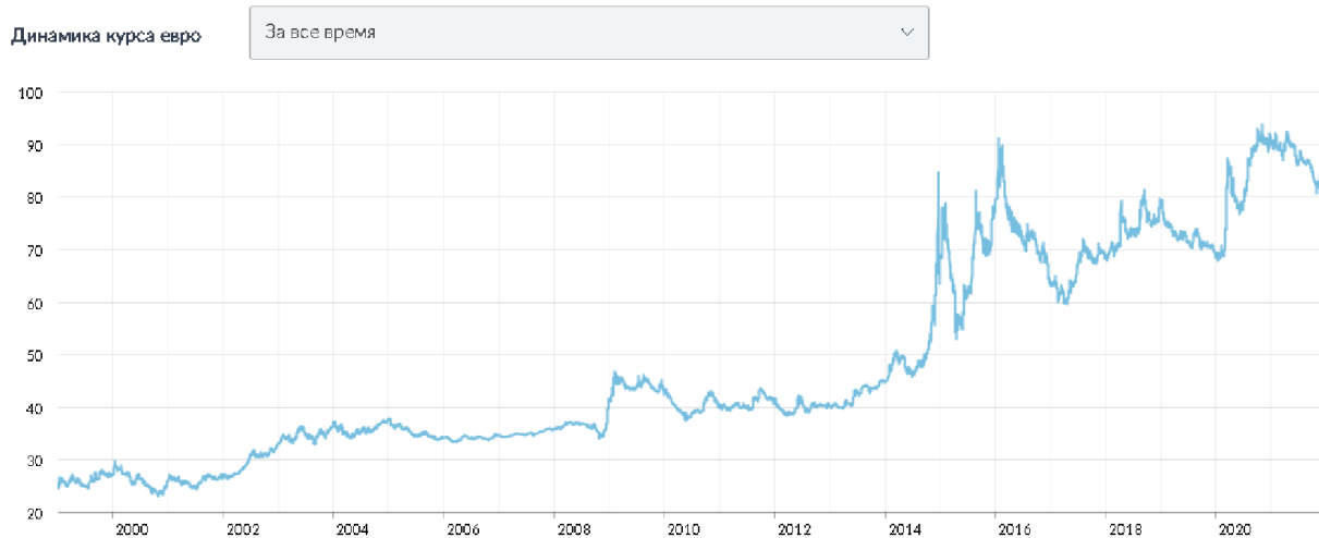
Рис. 3. Курс евро (EUR) к рублю по ЦБ РФ с 2000 г. по 2020 г.

ниях между местным населением и выходцами из других стран в целях предотвращения этноконфессиональных конфликтов стало практически невыполнимым [1].